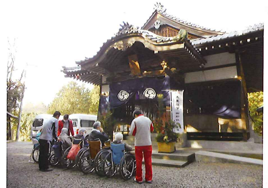
萩岡神社へ初詣に行きました。 今年も1年、健康でありますように!!