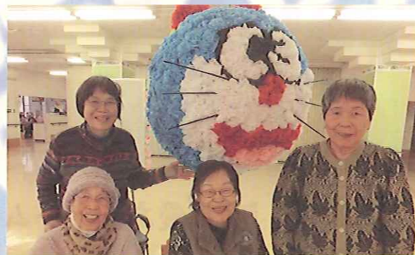
新居浜登り道サンロード冬の七夕作品はドラエもん、ドラミちゃんのリバーシブルです。