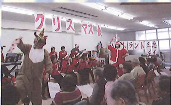
オカリナの音色でクリスマスパーティーです。ジングルベル♪ジングルベル♪