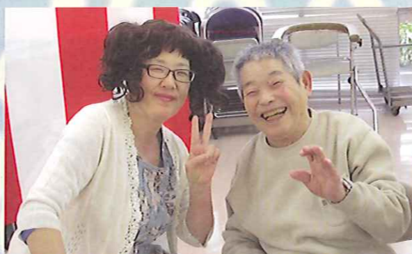
スナック「ハートランド三恵」のママさん?