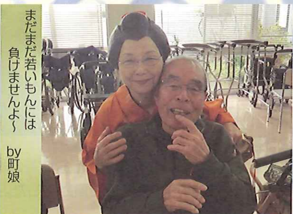
まだまだ若いもんには負けませんよ by 町娘