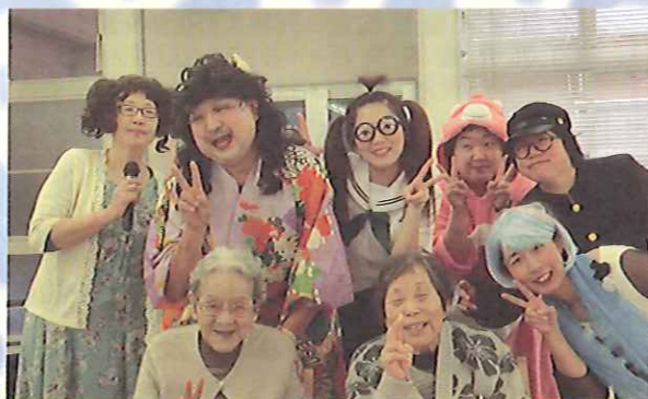
忘年会仮装紅白歌合戦「熱唱しました」