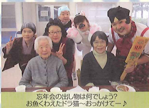
忘年会の出し物は何でしょう? お魚くわえたドラ猫〜おっかけてー♪