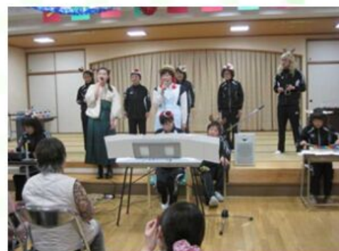
③ NHKの花子とアンで話題になった 『にじいろ』を演奏します。