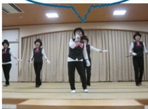
① 原田会と2階スタッフの歌とダンス