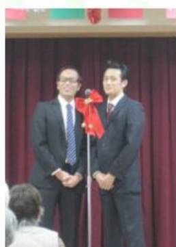
② 漫才コンビ名『旧川内町』 かわいい若い子がいると聞いて やってきました!