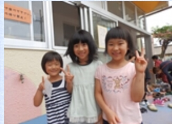
卒園生が遊びに来てくれました。