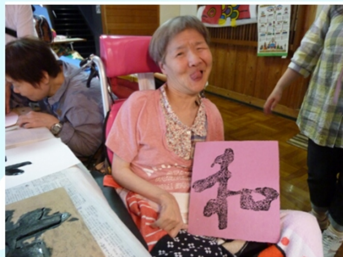
版画体験しました。上手でしょ？！