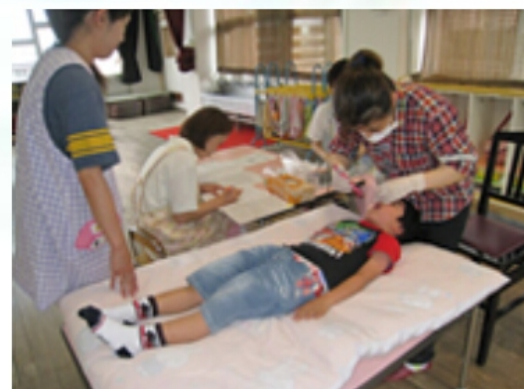
食べた後は、歯をみがきましょうね