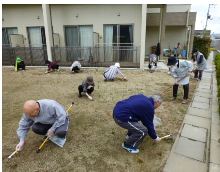
裏庭の環境整備にみんなで取り掛かりました。