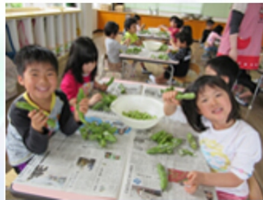
5/21 5歳児 (そら豆の皮むき)