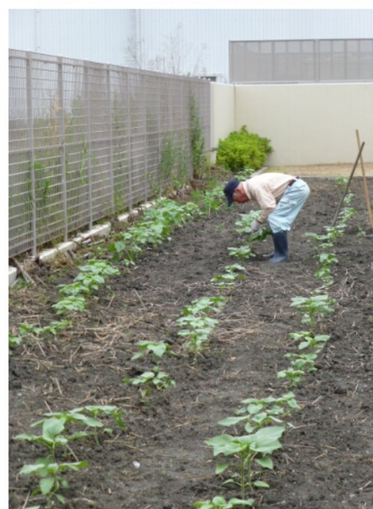
農業部長は、畑の手入れに精を出されています。