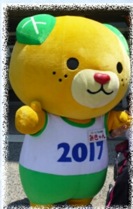
愛媛県のイメージキャラクター「みきゃん」も応援に来たよ！

職員や家族が声援を送る中、日頃の練習の成果を發揮し気持ちのいい汗を流しました。各施設のページもご覧ください。