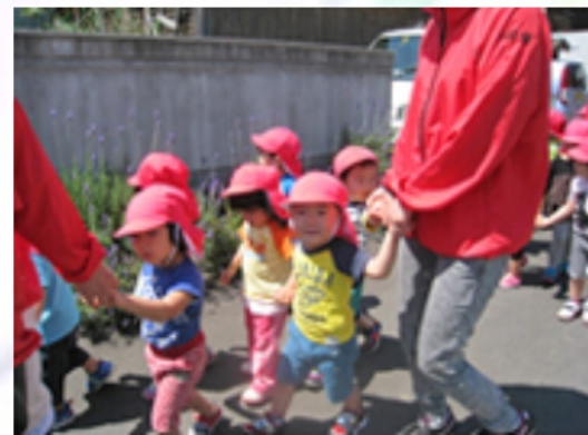
2歳うさぎ (お友達と手をつないで)