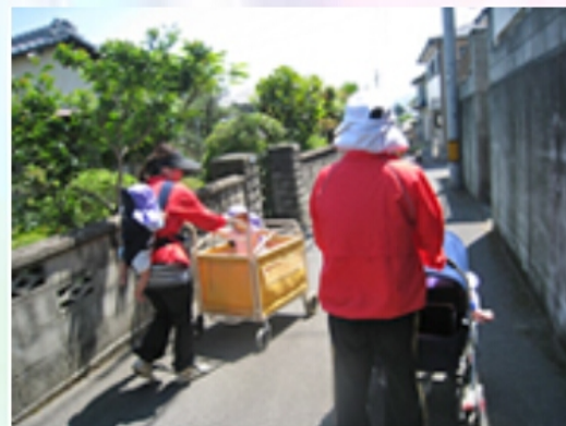
0歳ひよこ (ベビーカーに乗って)