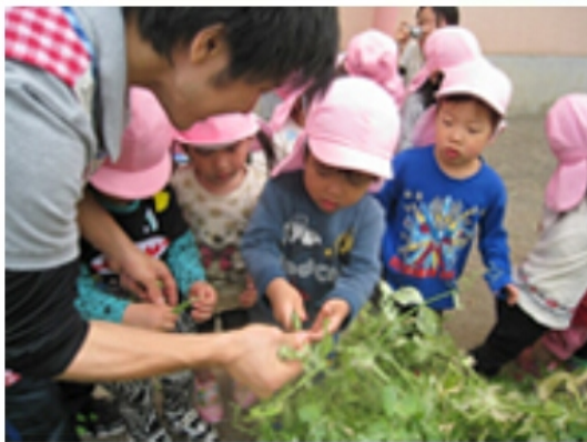
5/20 3歳児 (グリーンピースの収穫)

*子どもが自分の判断で賢く選んで食べ、将来、健康な食生活ができるよう栄養士と連携して食への関心を高めています。