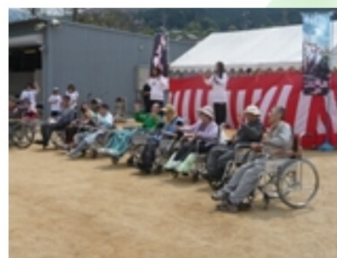
利用者さんも一緒にダンス。。。 かっこよかったです。