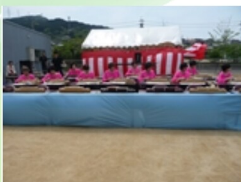
素敵な演奏♪、ステキな衣装で みんなを楽しませてくれました。