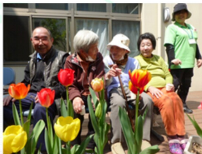
ぽかぽか陽気の中、中庭でミニデイを行いました。