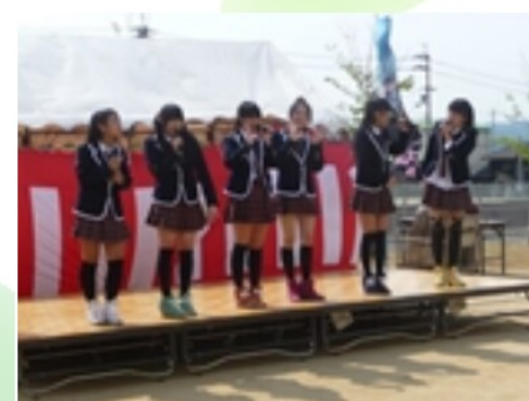
愛の葉ガールズのステージ 盛り上がりました。