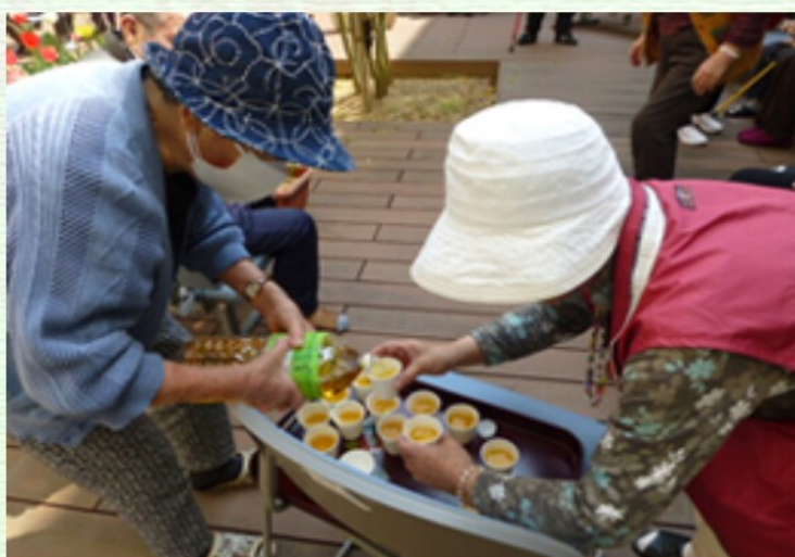
のどが渴いたなあ…。 そんな声も聞こえてきたときには お茶を配りました。 みんながお手伝い。