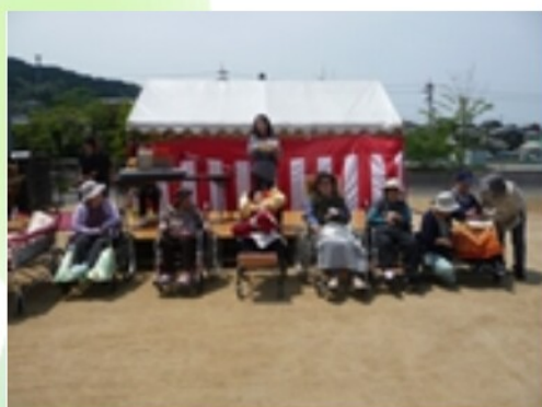
みんなで歌いオープニングを飾りました

ご協力をいただきました皆様方のおかげで盛大に開催することが出来ました。ありがとうございました。