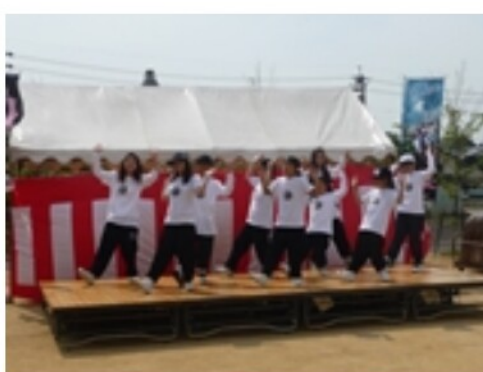
ノリノリのストリートダンス