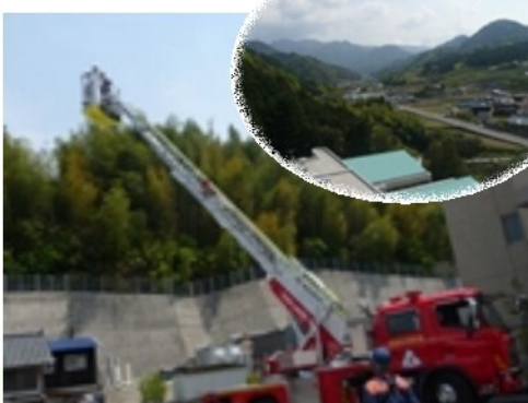
絶景かな絶景かな。。。