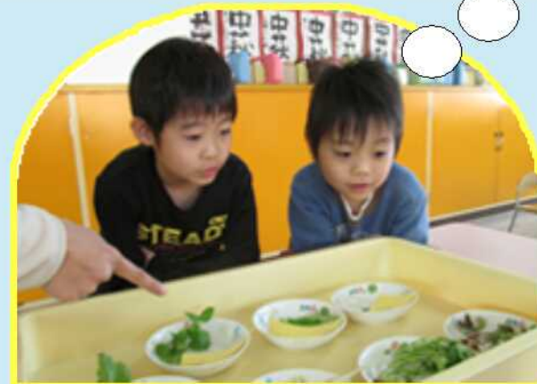
『これが七草、ほんと勉強になるね』