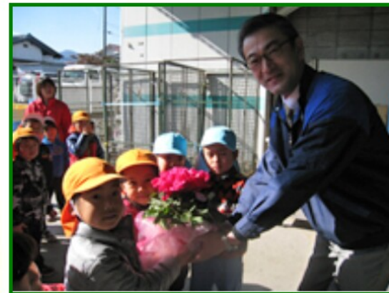
コープ中萩 (ペンぎん・ぞうぐみ)