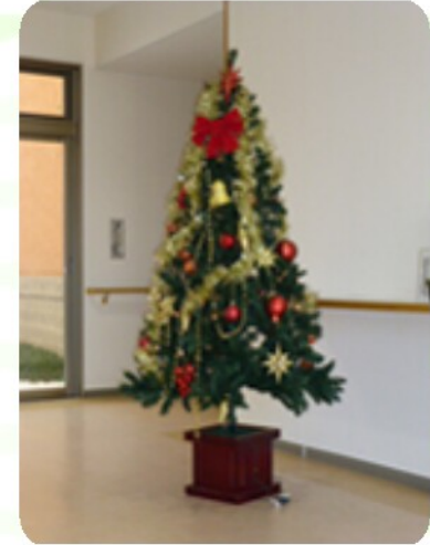
1m80cmのツリー 新しく購入

11月28日（木）クリスマスツリーの飾り付けを行いました。今年は大きなツリーが2本仲間入りし、正面玄関や、食堂・・・それぞれのフロアーがステキに輝いています。