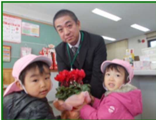
中村郵便局 (いるかぐみ)

「いつもお仕事お疲れ様、これからも頑張ってください。」とお礼を言い、お花と歌のプレゼントをしました。