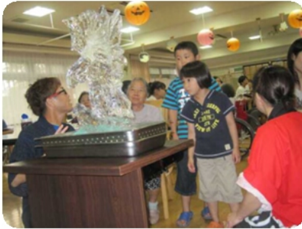
氷の彫刻に興味津々の子供たち。 さあ～これは何でしょう？