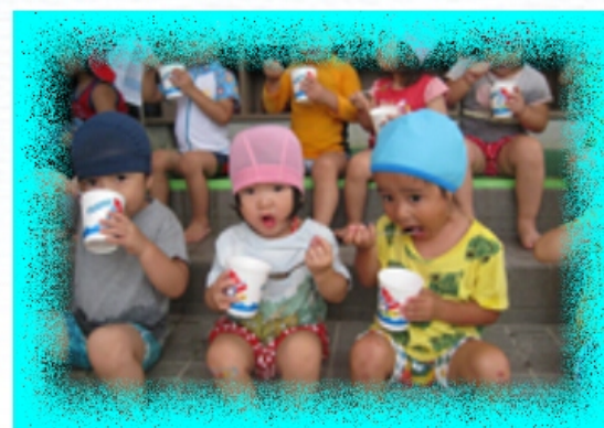
1・2歳児うさぎぐみ