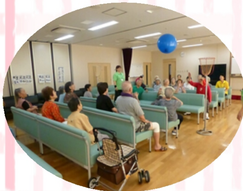
『風船バレー』どこへ飛んでくるかわかりません。職員も油断できません。

得点を競い合います。 「さて何点になったかな？ 今回のチャンピオンは誰かな？」 慎重に的を狙っている表情は皆様真剣です。 後姿より想像して下さい。