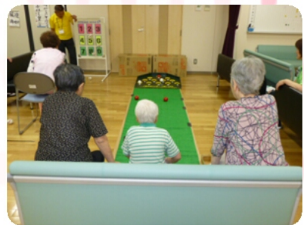
『ストライクアウト』 『スカットボウル』

得点を競い合います。 「さて何点になったかな？ 今回のチャンピオンは誰かな？」 慎重に的を狙っている表情は皆様真剣です。 後姿より想像して下さい。