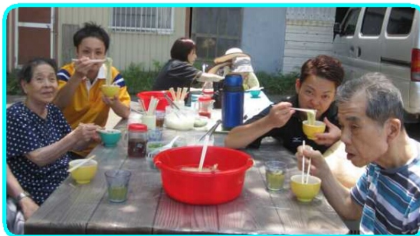
食欲のおちる夏場は、 麺類がいいの～。ズルズル～。