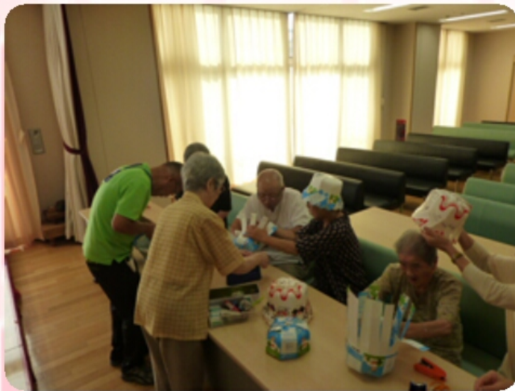
牛乳パックを使って『帽子作り』 難しいところは、お互い助け合って工作 に励んでいます。