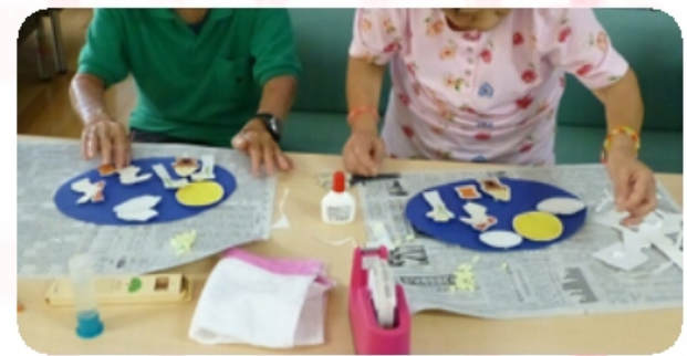
季節感あふれる『壁飾り作り』