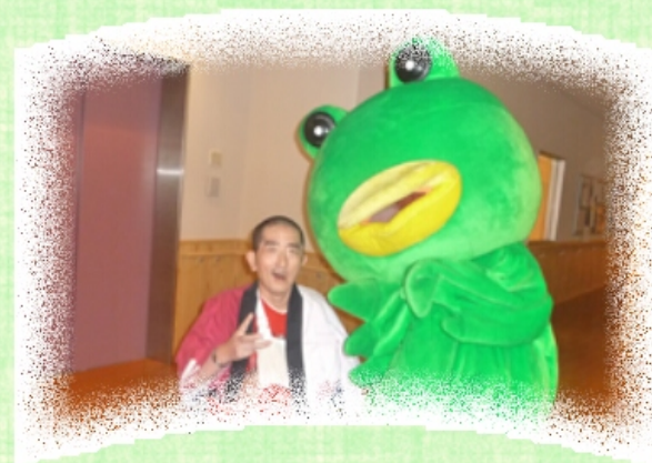
伊予銀行 「とりカエル」