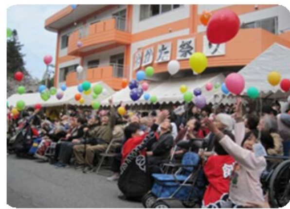
やかた祭り～オープニングセレモニー～

希望の館では、毎年恒例となりました「第11回やかた祭り」をH25.3.24(日)に開催しました。 オープニングセレモニーでは“希望の館からのメッセージ”と“ひまわりの種”を付けた100個の風船を青空に飛ばしました。 すると、なんと言うことでしょう！ H25.4.15にその風船と手紙を拾いましたという素敵なお便りが希望の館に届きました♡ なんとお便りをくださった方は、 静岡県 の方でした。富士山の近くまで風に乗って風船が飛んで行ったのかと思うと、空はどこまでも続いているんだなあと・・・いろいろな希望が広がりました(^_^) 希望の館「やかたまつり」では、以前にも奈良県まで風船が飛んで行ったことがありました。 お便りをいただいたのは、今回が二度目になります。 お便りのお礼をお伝えすると、ヒマワリの種を畑に植えますとのことでした。私たちの気持ちが込められた大きなひまわりが静岡県で咲いてくれることを職員一同楽しみにしています。 お手紙をいただいて本当にうれしかったです。 ありがとうございました！！