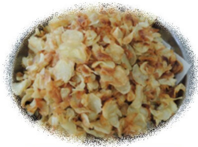
ポテトチップスの出来上がり

◎中萩保育園では、栄養士、調理員と連携して「心も体も元気に大きくなろう!!」を目標に、菜園活動や食育活動に取り組んでいます。自分たちで植えた野菜を収穫して、みんなで楽しく食べることが、食への関心を深めています。食べる楽しさがやる気にもつながっています。