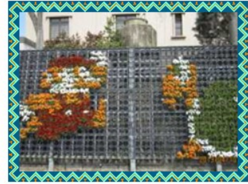
☆立体花壇 マリオの形になっているなんて素敵