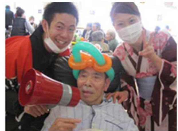
オープニングセレモニー 風船飛ばし