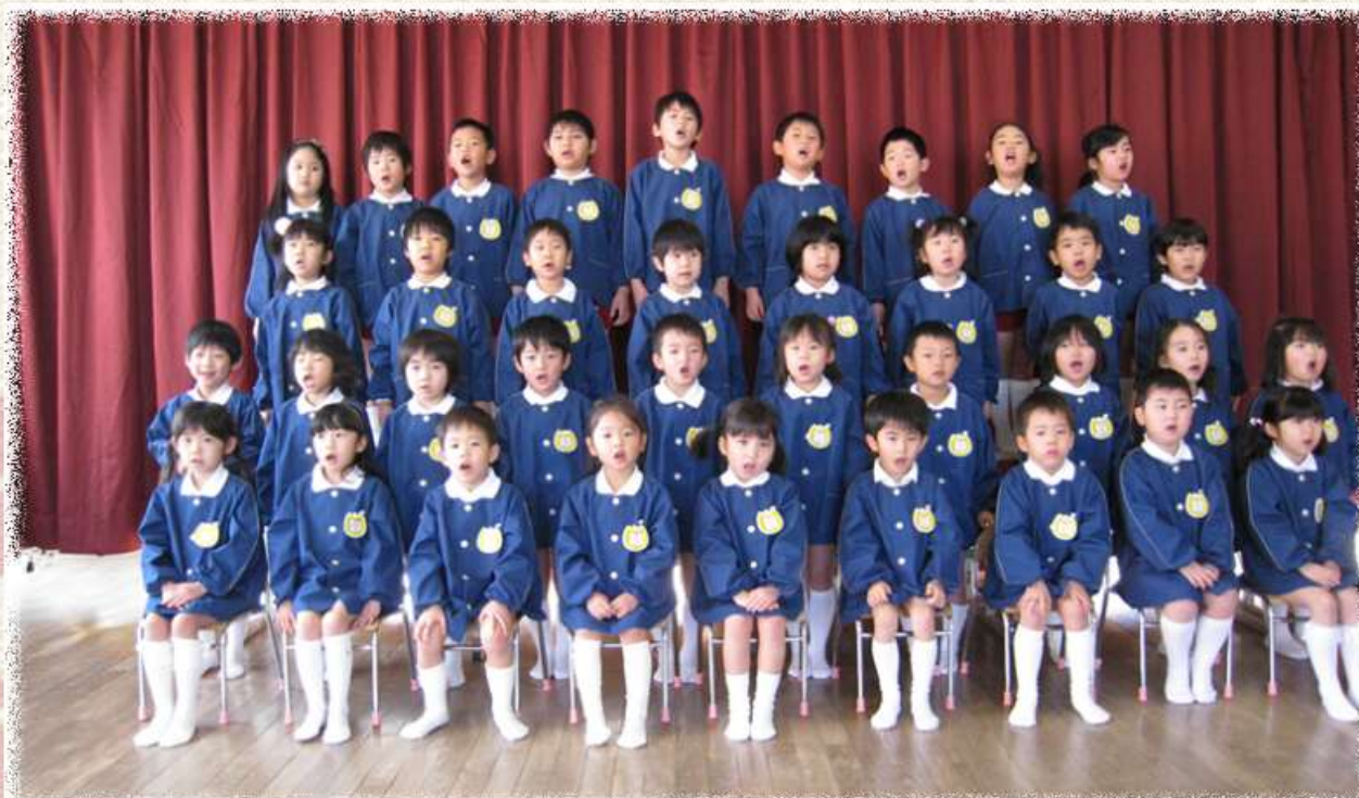
年長児36名(きりんぐみ)です。

4月に社会福祉法人三恵会「中萩保育園」がスタートしましたが、記念すべき第一期生36名がもうすぐ巣立って行きます。取材では、歌を歌ったり将来の目標を堂々と発表する等、その成長ぶりをうれしく思いました。新しい春の訪れと共に小学校へ入学する子どもたちは、期待に胸をふくらませ明るく元気いっぱいでした。