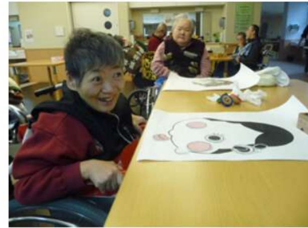
三恵ホームの玄関に飾ってる手作りの超特大羽子板

お正月に福笑いをしました。様々な表情が出来上がり、その度にみんなで笑って楽しみました。