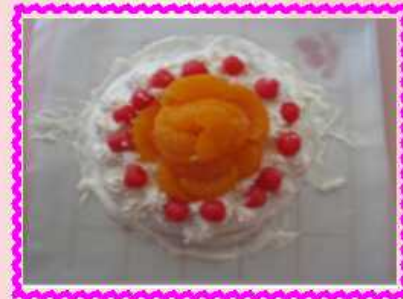
フルーツをトッピング