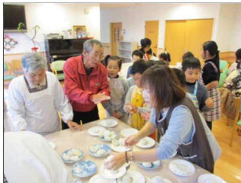
「お年寄りも子供も職員も、みんな上手に丸めたよっ！」