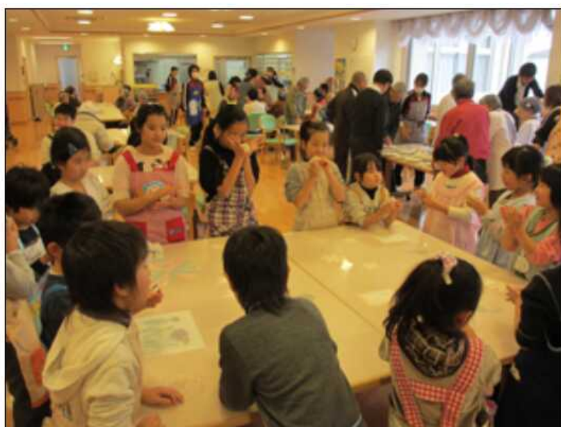
「自分で丸めたお餅、おいしいよっ！」