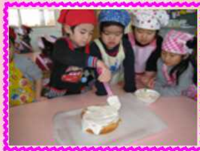
スポンジケーキに へらで生クリーム