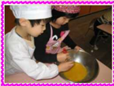
卵を割って泡立てる