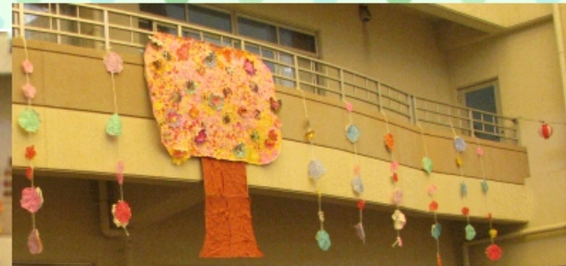
あゆみ苑利用者 作

4月9日(土)にやすらぎの郷三施設合同のお花見が行われました。 手作りの桜や飾りで会場を彩り、「滞つくし会」様による三味線の演奏、新人職員紹介も行われ、盛大な会となりました。 また、きぼうの苑御家族様も多数ご参加され、会場は談笑の華が咲いていました。