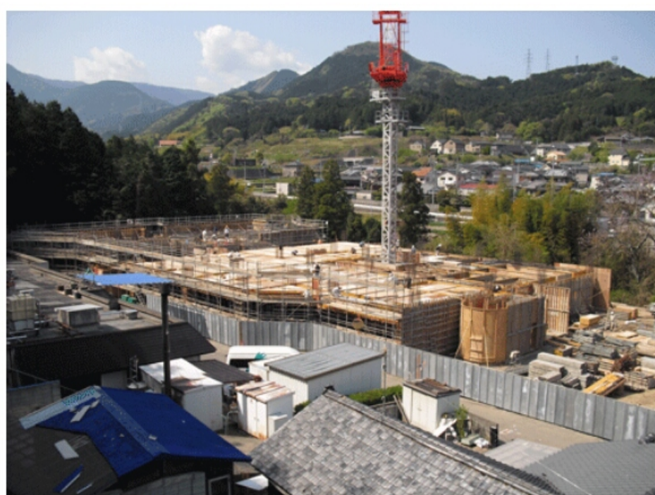
三恵ホームは今・・・