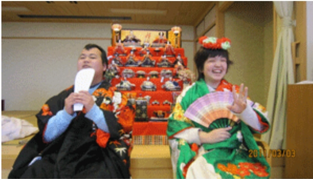
かわいいお内裏様とお雛様♪