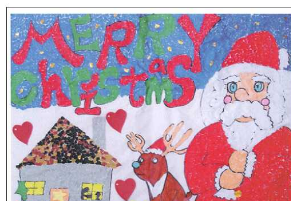
「クリスマス ちぎり絵」 施設名 希望の館 名 前 二階利用者共同作品