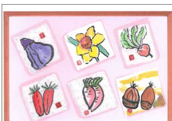
「絵手紙風コースター」 施設名 ハートランド三恵 名 前 通所介護利用者合作