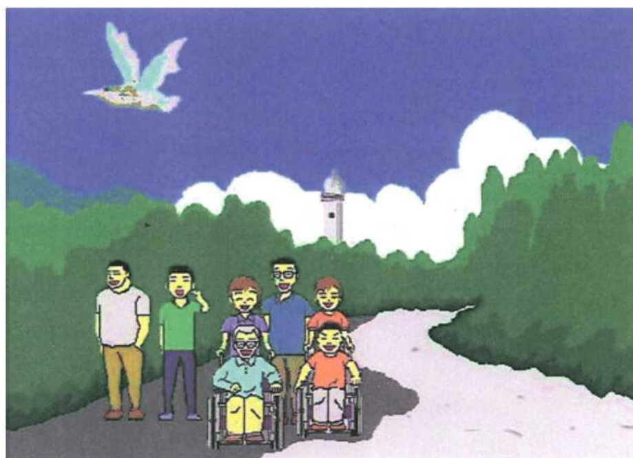
タイトル「夏の笑顔」 施設名 三恵ホーム ペンネーム サンケイン