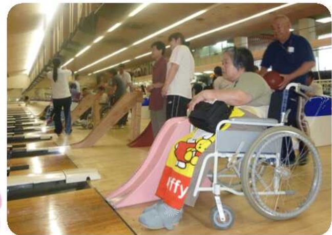
どーして??なぜ?? まっあく転がらないのぉ～