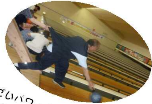
すごいパワー！！ボールといっしょに転がって行きそうです。

恒例の合同ボーリングもご利用者、職員共にヒートアップし、楽しいひとときを過ごす事ができました。ご利用者の一生懸命さが伝わり、職員のアドバイスにも熱が入ります。ストライクやスペアが取れるとハイタッチで喜ばれる姿が印象的でした。