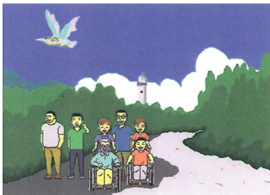
タイトル「夏の笑顔」 施設名 三恵ホーム ペンネーム サンケイン