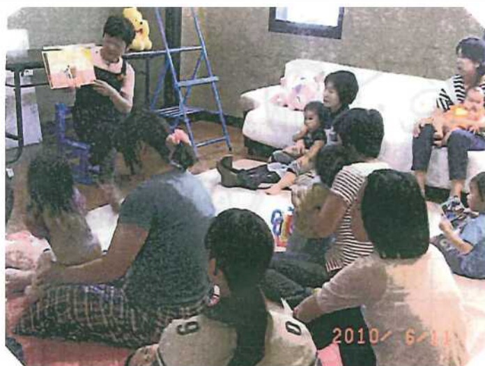
お話会 (回転木馬さん)