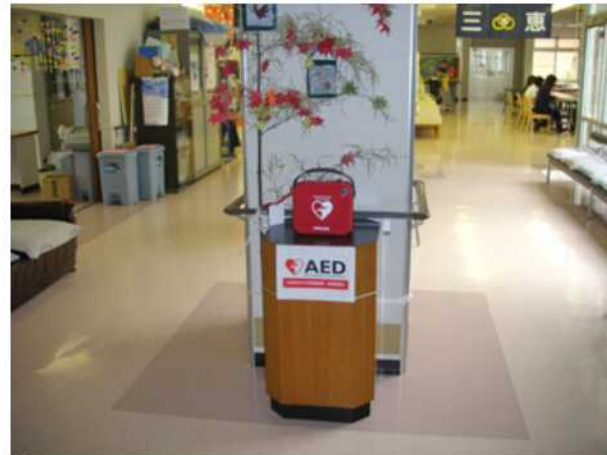
AEDの設置場所は、日中はデイサービス、夜間は2F 寮母室。