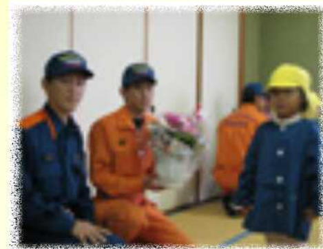
いつもありがとうございます。