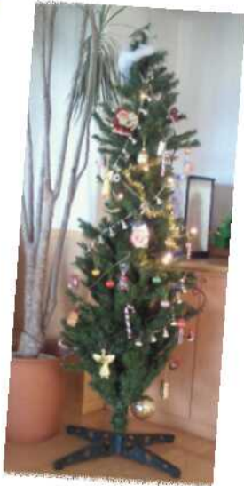
コミュニティハウス三恵 玄関