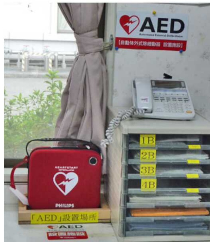
三恵ホーム 1階 医務室