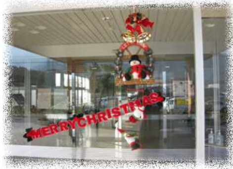
リハビリステーション三恵荘 玄関