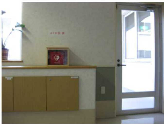
きぼうの苑 2F 廊下 (非常階段の横) 設置

平成21年11月19日 (木) 職員勉強会にて、AED取扱の説明会を実施しました。