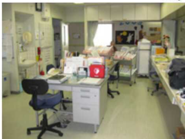
AEDは2F診療室に設置しています。