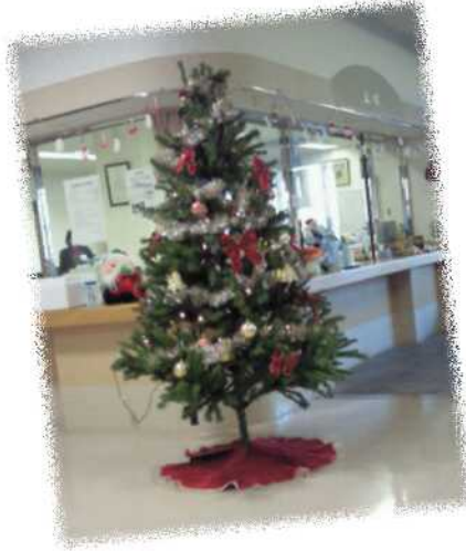
やあらぎの郷 玄関