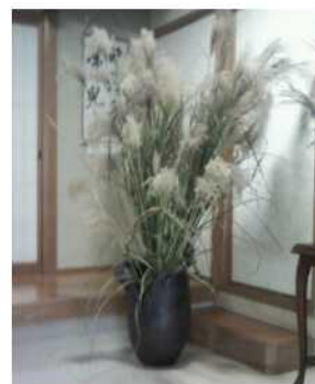
やすらぎの郷(お茶室前)