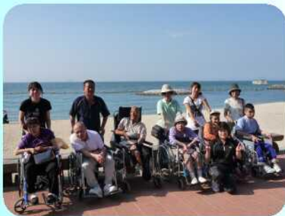
ふたみシーサイドパークにて 記念撮影

社会見学で利用者様6名・職員ご家族7名で清流の里ひじかわ、オズメッセ21、ふたみシーサイドパークに行ってきました。