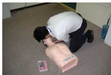
人形を使っての実施