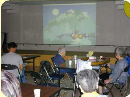
超大型紙芝居（月のうさぎ）