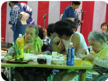
三味線の音色を聞きながら。。。。