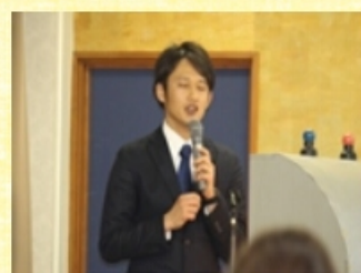
優秀賞 希望の館 通所リハでのコーディネーショントレーニングの効果 脳と身体を繋げ、活気ある在宅生活を目指す