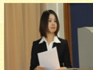
優秀賞 恵 海 職員の健康を守る活動 ～働きやすい職場を目指して～