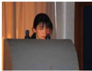
ハートランド三恵