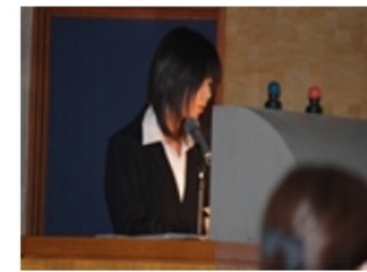
リハビリステーション三恵荘