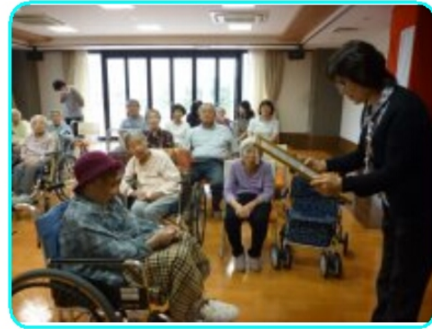
グループホームかがやき

敬老会のお祝いを午前中にうみかぜ、また同日午後からグループホームかがやきが実施し、ボランティアの方の訪問があり歌・大正琴の演奏等楽しく過ごされました。