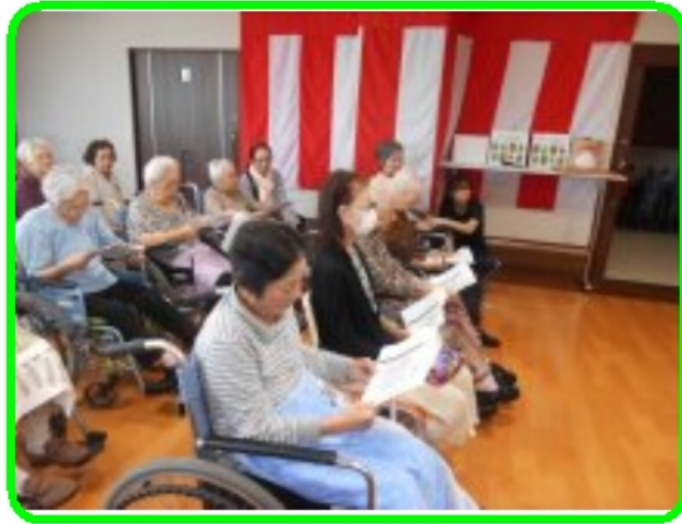
特別養護老人ホームうみかぜ