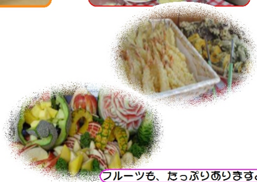
フルーツも、たっぷりありますよ